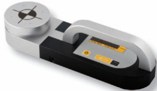
Safety tool, Somfy, Rottenburg