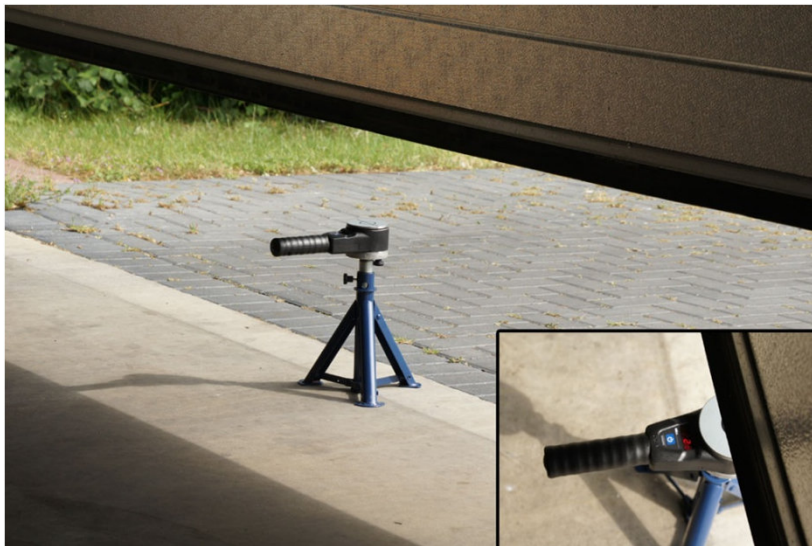
KMG lite, Firma GTE Viersen

Neue ‚günstigere‘ Versionen auf dem Markt