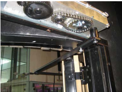
Die Antriebslösung - ohne Verkleidung

Auch geöffnet sind die Türen kaum erkennbar.