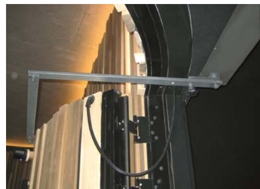
Die Antriebslösung - komplette Verkleidung