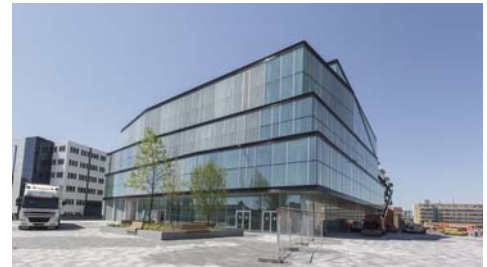
Das Theater "De Kom" in Nieuwegein

Das Problem konnte in intensiver Zusammenarbeit zwischen Türhersteller und DICTATOR, Hersteller für Spezialantriebe, gelöst werden. Als Antrieb wurde der Drehtürantrieb DICTAMAT 310-21 XXL eingesetzt, der bis zu 600 kg schwere Türen bewegen kann. Der DICTAMAT 310-21 XXL wurde auf der „Türrückseite“ komplett mit Steuerung und USV-Notstromanlage in einem vom Kunden angefertigten Gehäuse montiert. Ebenso stellte der Türenhersteller nach Absprache einen speziellen Hebel zur Kraftübertragung her, dem auch der besondere Bewegungsradius keine Probleme machte.