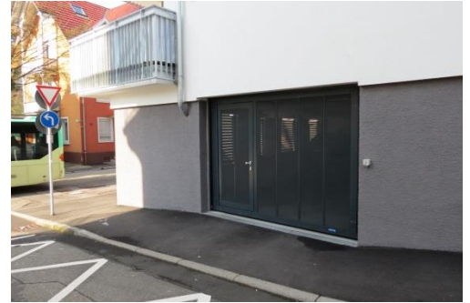
Kipptor mit Türe in RAL, geschlossen

Neben offenen Füllungen wie Lochblechen, Lochgitter oder Streckgitter können auch geschlossene Varianten wie z.B. Glattblech, Lamellen, Panele, Sektionaltor-Optiken oder ähnliches zum Einsatz kommen. Natürlich auch farblich angepasst an die entsprechende Tor-Umgebung. Da bleiben keine Wünsche offen.