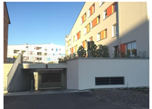
Kipptor mit Seitentüre und Sprossen