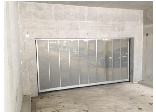
Alu-Tor mit Lochblech-Füllung zur Belüftung

Der Grundrahmen des Torflügels bietet dabei alle Möglichkeiten: Es kann natürlich eine Schlupftür integriert werden und der Kunde kann aus einer Vielzahl unterschiedlicher Füllungen und Oberflächen