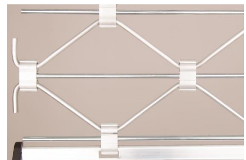
NEU: Rollgitter Typ M mit Stahl-Zwischenstab , zum Patent angemeldet