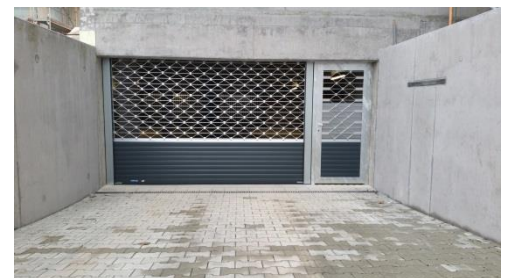
Tiefgaragen-Rollgitter MRTG plus mit Marderschutz